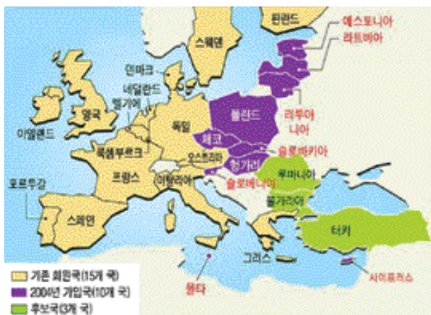
〈그림 1〉 유럽연합이 포괄하는 영역 : 현재 유럽연합 회원국은 25개 국, 유럽시민은 4억 5천만 명에 이른다.

한편, 유럽연합이 점차 질적으로도 발전하면서 단순히 독립국가들의 연합체로서 기능을 넘어 유럽연합 자체가 독자적인 집행력과 권력을 가지기 시작하였다. 예컨대 과거에는 개별 주권국가의 고유영역(헌법, 군대, 경찰 등)이었던 분야에 대해서도 점차 통합의 가능성을 모색하고 있다.