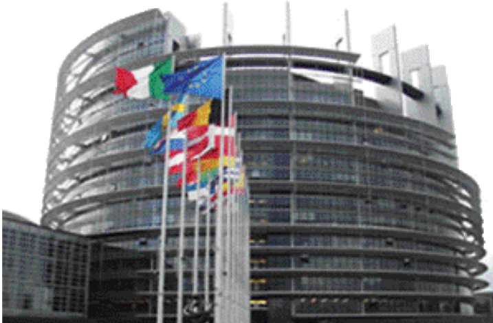
〈사진 1〉 유럽연합 의회 건물 : 이 건물은 아직 공사가 끝나지 않은 것처럼 보이는 나선형 원통모양을 하고 있다. 이는 유럽연합의 실험은 계속되며, 그 미래는 유럽시민들이 결정한다는 것을 상징한 것이다.