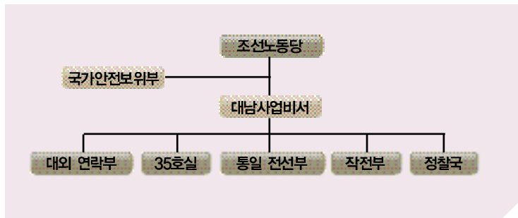
〈도표7〉 북한의 대남전략 기구