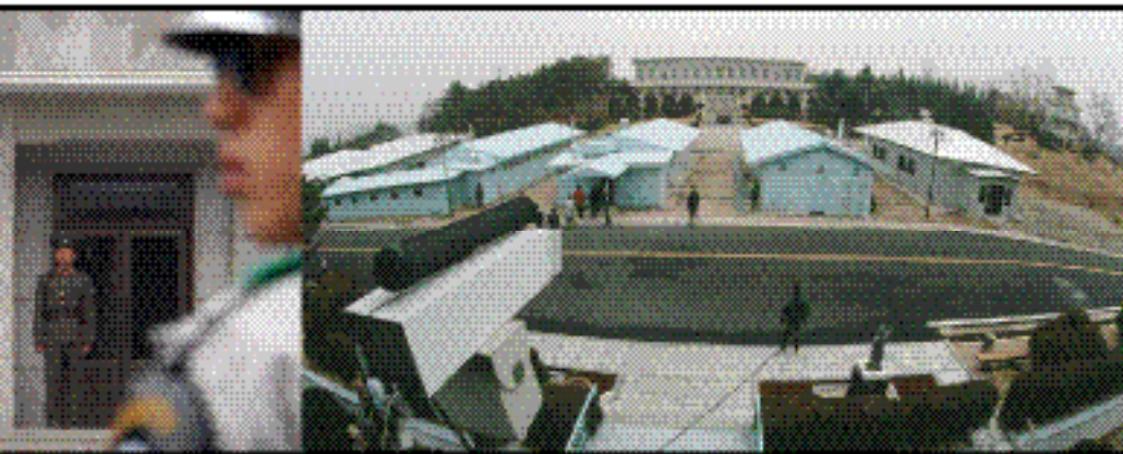
유동업 (치안정책연구소 선임연구원)