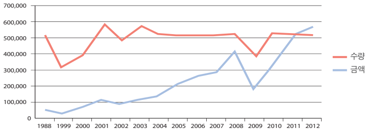
〈그림 1〉 북한의 원유수입 현황

※ 주: 2009년 수입 감소는 실제 감소가 아닌 4개월 간 실적 미공개에 기인