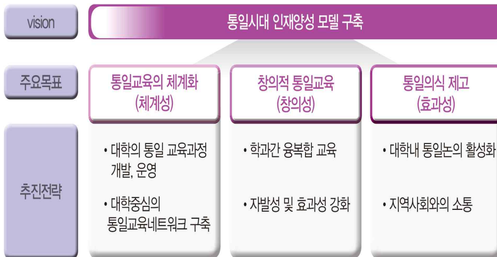
[표 1] 충남대학교 통일교육 6대 핵심역량 목표