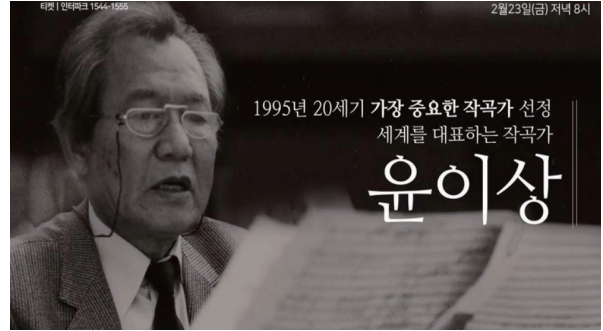
고국에 돌아오지 못한 윤이상