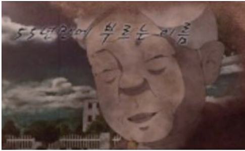
(통일교육원, 2015년 제작)

6·25 전쟁 당시 국군으로 전쟁에 참전한 남편을 다시는 만나지 못한 한 아내의 실제 이야기를 바탕으로 재구성한 애니메이션으로 분단의 아픔을 보여준다. 한글을 못 배웠던 아내는 남편의 입영 통지서를 받고도 읽지 못했고, 그렇게 아무런 준비 없이 갑작스럽게 남편을 전쟁터로 보냈다. 남편은 55년 동안 기다려도 오지 않았고, 그동안 아내는 한글을 배워 남편에게 통일이 되면 꼭 다시 만나자는 내용의 편지를 쓴다.