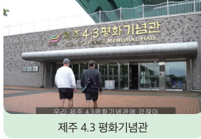
제주 4.3 평화기념관