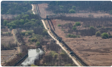
비무장지대는 어떤 곳일까